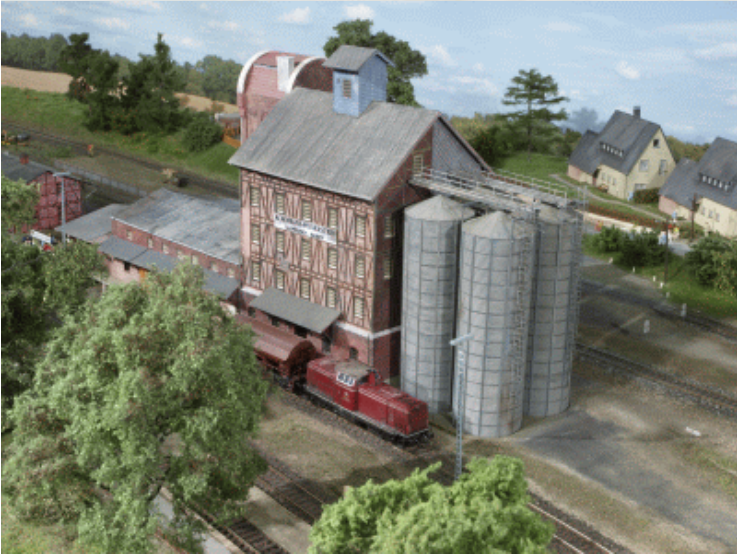
Présentation de cette réalisation dans un magazine spécialisé allemand